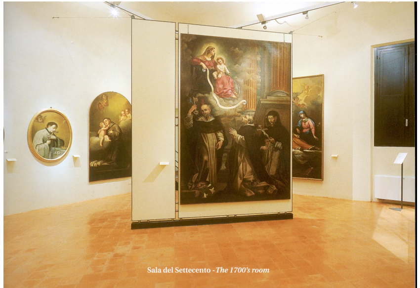
Sala del Settecento - The 1700's room

DOFO Documentazione fotografica/ nome file