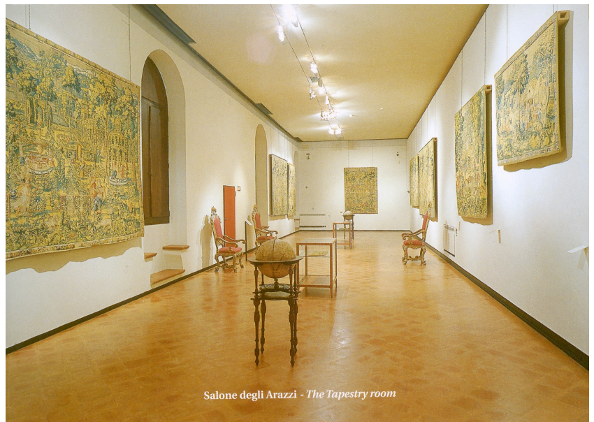
Salone degli Arazzi - The Tapestry room

DOFO Documentazione fotografica/ nome file