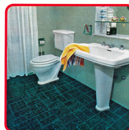
TIPO MARMORIZZATO formato n°/re 200/180 (alt. 204/102) E' il primogenito della ceramica per pavimenti. Armoniosa fusione di due colori, conserva, nella sua brillantezza, doti di provata resistenza. Gli 11 colori prodotti permettono una facile soluzione dei vostri problemi di scelta.

DOFO Documentazione fotografica/ nome file