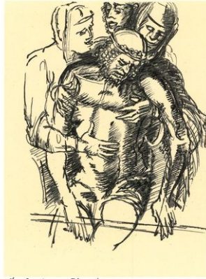
da Aulre - Manteau